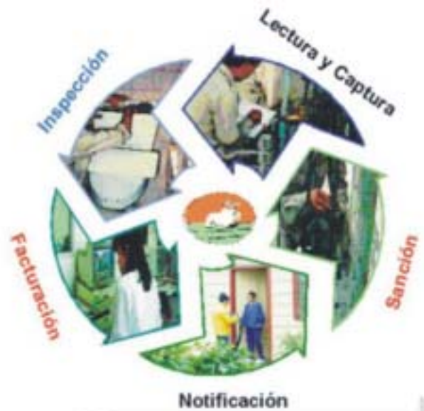
Ciclo de facturación de los servicios